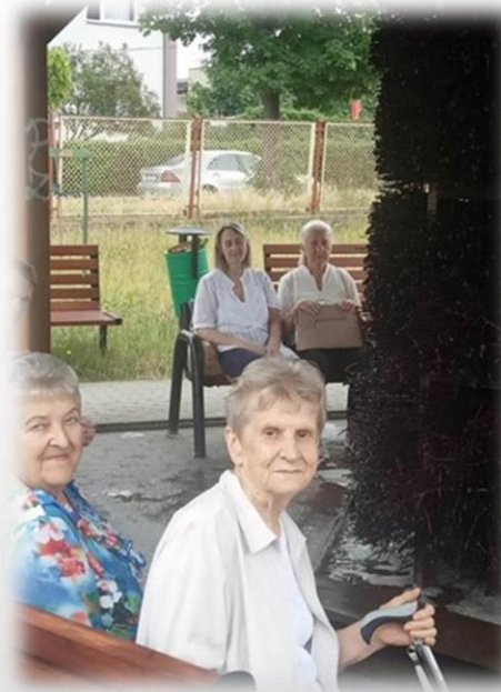
wyjazdy na tężnię solankową