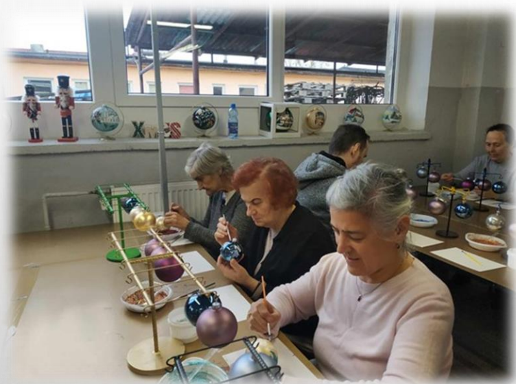
warsztaty malowania bombek - Złotoryja