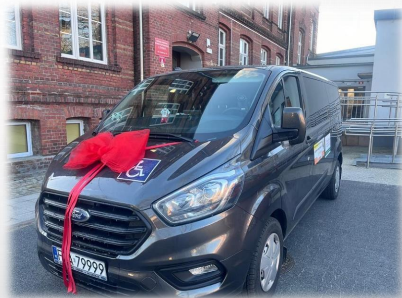
nowy samochód dla DDS+

W 2023 roku Miejski Ośrodek Pomocy Społecznej w ramach Programu wyrównywania różnic między regionami III” obszar D – likwidacja barier transportowych realizowanego przez Państwowy Fundusz Rehabilitacji Osób Niepełnosprawnych , zakupił samochód przystosowany do przewozu osób z niepełnosprawnościami, uczestników Dziennego Domu Wsparcia/Dziennego Domu „Senior+”. Całkowity koszt zakupu samochodu wynosił 228.779,99 zł . W tym dofinansowanie z PFRON w wysokości 116.522,50 zł , udział własny gminy w kwocie 112.257,49 zł .