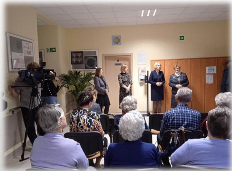
spotkanie z Panią Elżbietą Płonką poseł na Sejm RP