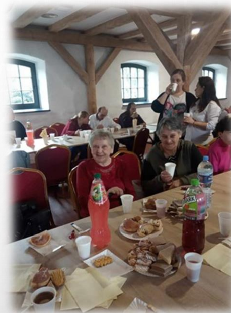
udział w zabawie integracyjnej zorganizowanej przez Stowarzyszenie Radość Życia