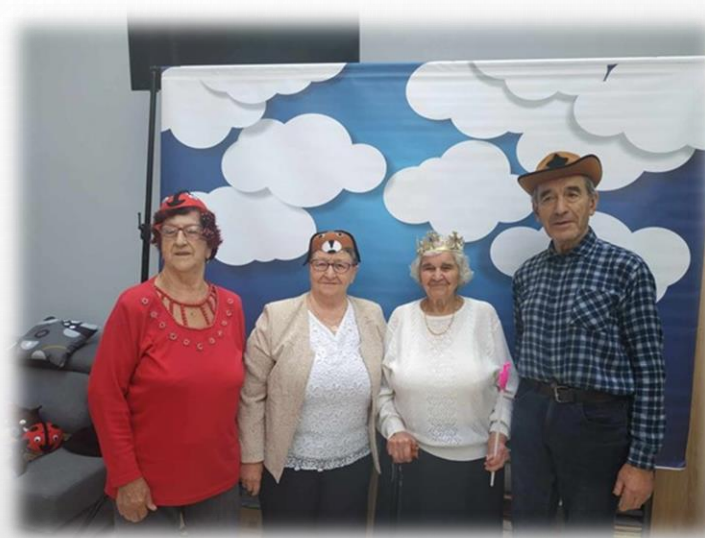
zabawy na wesoło - fotobudka