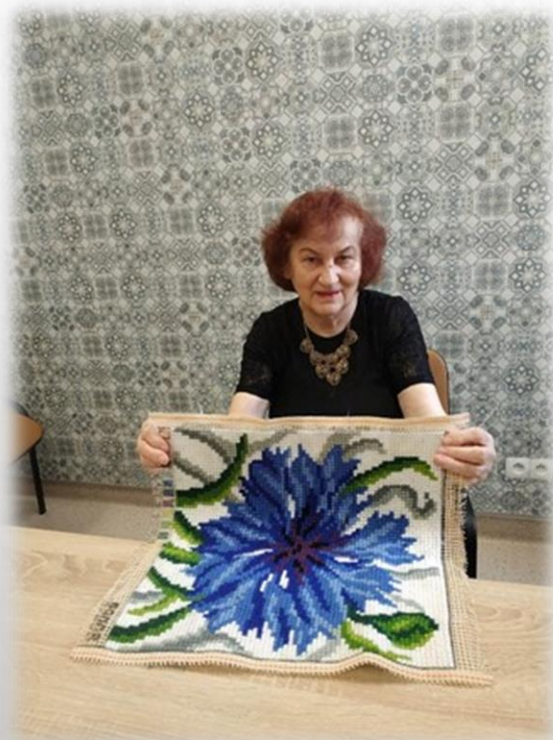
wyszywanie poduszek haftem krzyżkowym