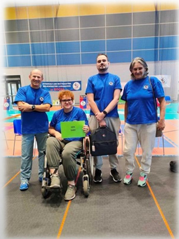
udział w XIV Mistrzostwach Województwa Lubuskiego w Bocci