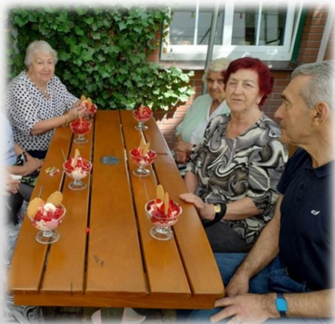
wyjścia do kawiarni