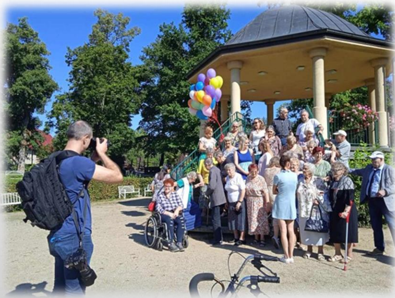
udział w sesji zdjęciowej