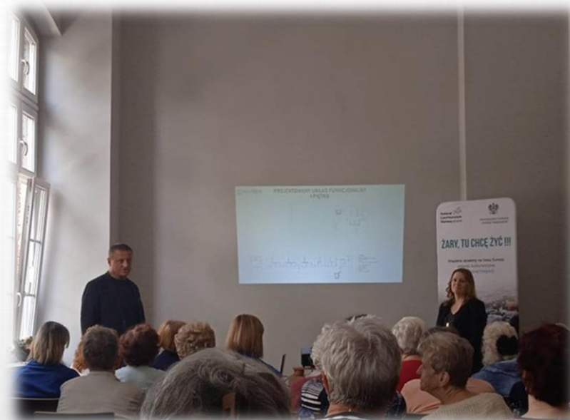
udział w spotkaniu z projektantem DPS w Żarach