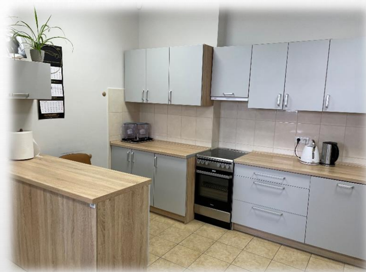
pracownia gospodarstwa domowego