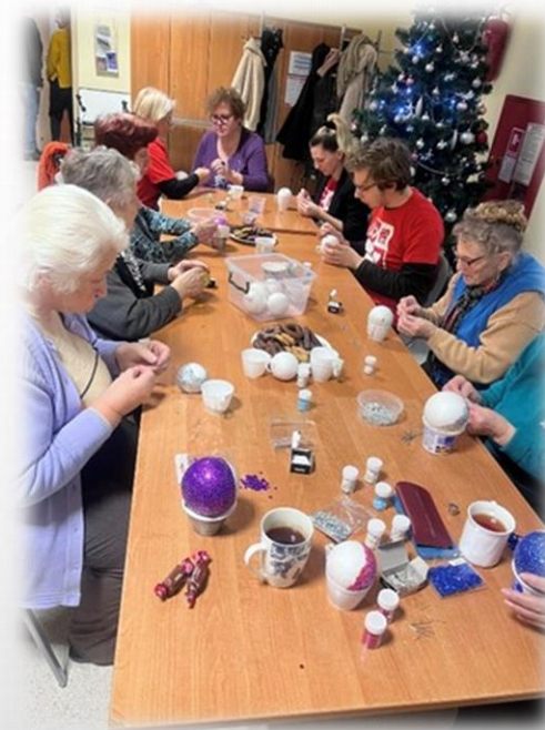
przygotowywanie świątecznych ozdób z wolontariuszami Szlachetnej Paczki