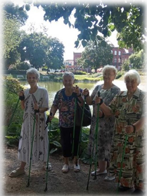
spacery Nordic Walking