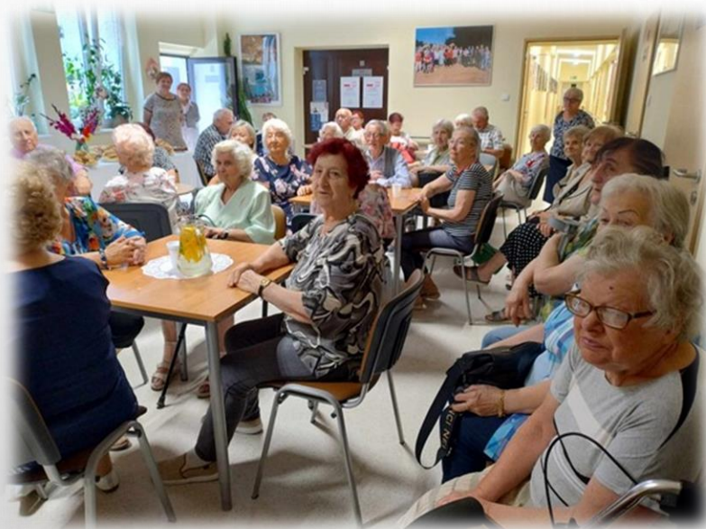
odwiedziny seniorów z DDS+ Nowa Sól