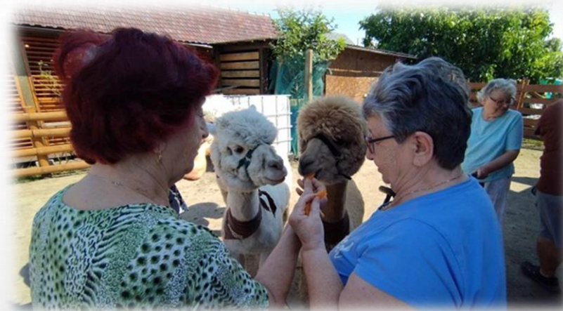
Wyjazd - Alpacze Ranczo w Iłowej