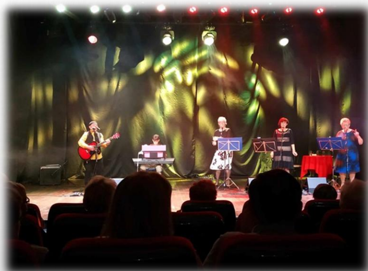
wyjście na koncert piosenek biesiadnych