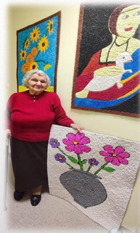
prace z kulek bibuły