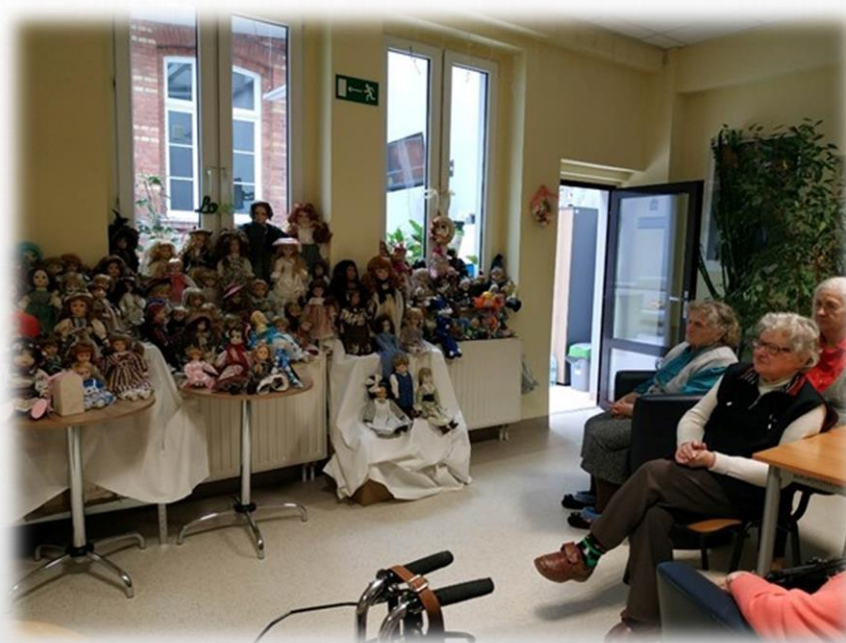
spotkanie z kolekcjonerką lalek