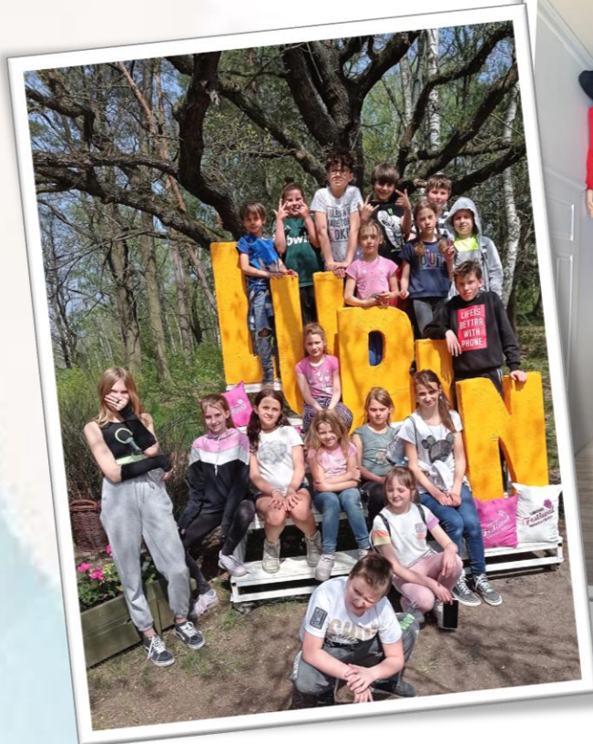
✿ Świetlica środowiskowa „Piątka” ul. Okrzei 35, 68-200 Żary