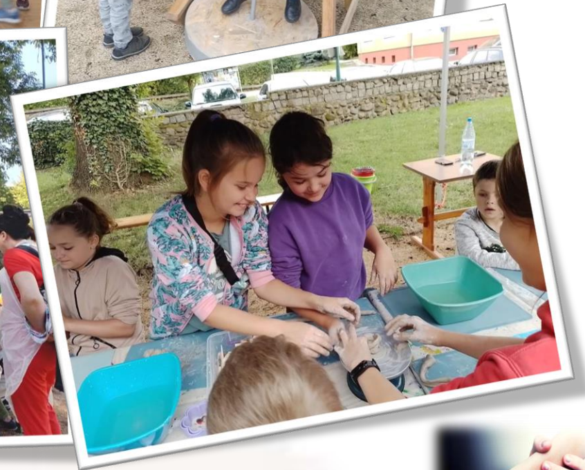
☀ Fotorelacja z wakacji zorganizowanych przez Muzeum Pogranicza Śląsko - Łużyckiego w Żarach