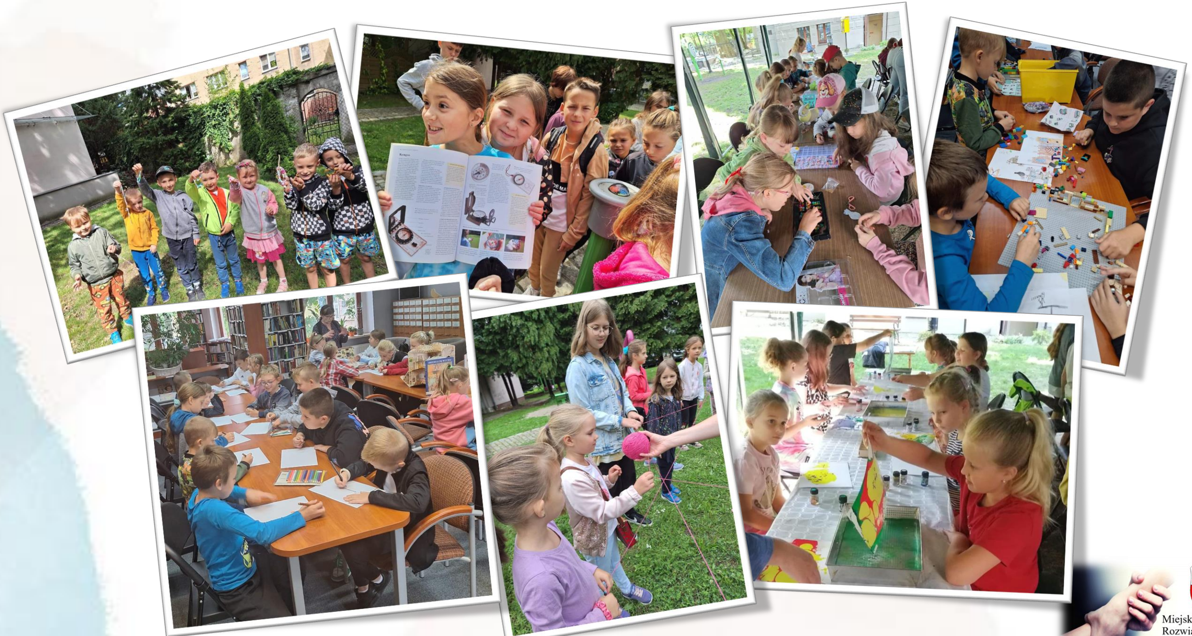
Fotorelacja z wakacji zorganizowanych przez Miejską Bibliotekę Publiczną w Żarach