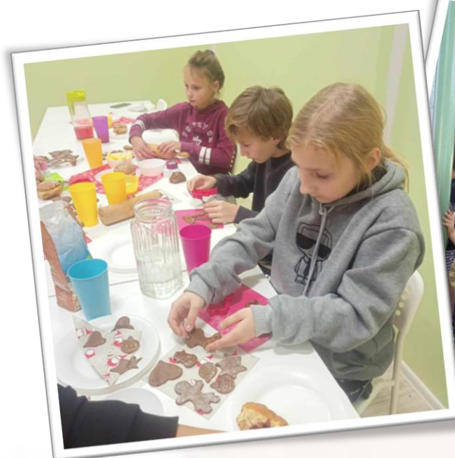
☀ Fundacja Pomocy Dzieciom „SI-GMA” ul. Pułaskiego 7b, 68-200 Żary