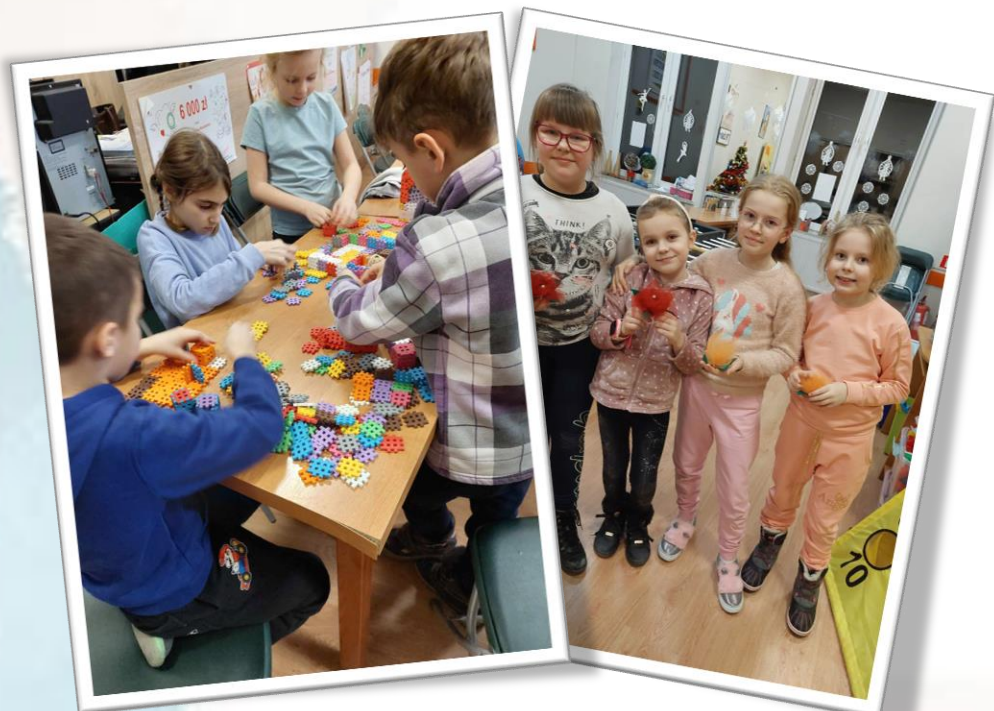
☀ Towarzystwo Przyjaciół Dzieci Świetlica „PROMYK” ul. Podchorążych 4a, 68-200 Żary

W roku 2023 na terenie naszego miasta funkcjonowały cztery świetlice środowiskowe, w których zabezpieczono 103 miejsca. Dzieci otrzymały pomoc w nauce. Miały okazję do wspólnej zabawy oraz integracji. Brały udział w zorganizowanych zajęciach rozwijających własne zainteresowania. Łącznie na ten cel przeznaczono 148 921,00 zł.