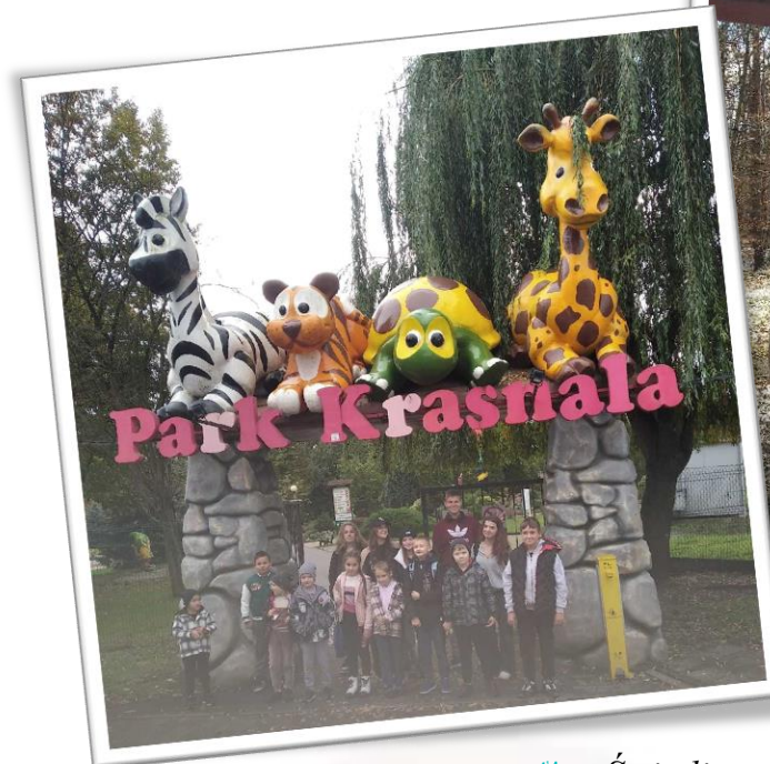
✿ Świetlica parafialna „Bajka” przy Parafii pw. NSPJ w Żarach